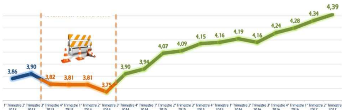
Figura 3: Satisfação de passageiros em relação às concessões aeroportuárias (milhões pax/ano).